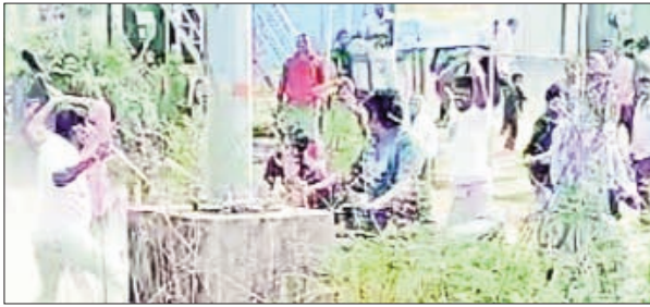
హడలిపోయారు. “ఏం జరిగిందో తెలియదు కానీ, ఒక్కసారిగా 1015 మంది కార్మికులు కర్రలతో వచ్చి స్థానికులపై పడ్డారు. అడ్డుకోబోయిన వారిని కూడా కొట్టారు” అని స్థానికులు భయంతో చెప్పారు. ఈ ఘటనపై బాధిత కుటుంబ సభ్యులు, గ్రామస్థులు కమలాపూర్ పోలీస్ స్టేషన్లో ఫిర్యాదు చేశారు. కేసు నమోదు చేసి దర్యాప్తు చేపడుతున్నట్లు పోలీసులు తెలిపారు.

ఇద్దరికి తీవ్ర గాయాలు, వీడియో వైరల్ పోలీసులకు ఫిర్యాదు: కేసు నమోదు, దర్యాప్తుకమలాపూర్ మండల కేంద్రమైన కమలాపూర్లో సోమవారం ఉదయం చోటుచేసుకున్న ఘటన స్థానికులను తీవ్ర భయాందోళనకు గురి చేసింది. ఉత్తరప్రదేశ్, బీహార్, మధ్యప్రదేశ్ రాష్ట్రాలకు చెందిన కొందరు వలస కార్మికులు విచక్షణ కోల్పోయి స్థానిక యువకులపై కర్రలతో దాడికి తెగబడ్డారు. ఈ దాడిలో ఇద్దరు స్థానికులకు తీవ్ర గాయాలయ్యాయి. ఒకరికి తల పగిలి రక్తస్రావం కాగా, మరొకరి బలమైన గాయాలైనట్లు గ్రామస్థులు తెలిపారు. క్షణాల్లో వైరల్ అయిన దాడి వీడియో పట్టపగలే మెయిన్ రోడ్డుపై జరిగిన ఈ దాడిని కొందరు తమ సెల్ఫోన్లలో చిత్రీకరించారు. కర్రలతో వలస కార్మికులు స్థానికులను వెంబడించి మరీ కొడుతున్న దృశ్యాలు సోషల్ మీడియాలో క్షణాల్లో వైరల్గా మారాయి. రక్తపు మరకలతో రోడ్డుపై పడి ఉన్న బాధితులను చూసి గ్రామస్థులు