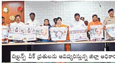
చిల్డ్రన్స్ వీక్ ప్రతులను ఆవిష్కరిస్తున్న జిల్లా అధికారులు

ప్రభాతవార్త ప్రతినిధి - జయశంకర్ భూపాలపల్లి బ్యూరో