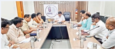
మాట్లాడుతున్న అదనపు కలెక్టర్ అశోక్ కుమార్

-అభ్యర్థుల సంఖ్య, షెడ్యూల్, భద్రతా కమిటీలన్నీటితో సమీక్షా... -అధికారులకు దిశానిర్దేశం చేసిన అదనపు కలెక్టర్ అశోక్ కుమార్