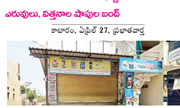
బండ్ పాటించిన ఫర్మలైజర్ దుకాణం

ప్రస్తుత వ్యవసాయ వ్యాపార రంగంలో ఎదురవుతున్న తీవ్రమైన సమస్యలను పరిష్కరించాలని డిమాండ్ చేస్తూ జాతీయ మరియు రాష్ట్ర ఆగ్రి ఇన్ ఫుట్ డీలర్స్ వెల్ఫేర్ అసోసియేషన్ పిలుపు మేరకు సోమవారం జయశంకర్ భూపాలపల్లి జిల్లా కాటారం మండలంలో నిర్వహించిన బండ్ జయవంతమైంది. కేంద్ర, రాష్ట్ర ప్రభుత్వాలను డీలర్ వ్యతిరేక విధానాలను నిరసిస్తూ మండలంలోని ఫర్మలైజర్, సీడ్స్ మరియు పెస్టిసైడ్స్ దుకాణాలన్నింటినీ వ్యాపారులు స్వచ్ఛందంగా మూసివేసి నిరసన తెలిపారు.